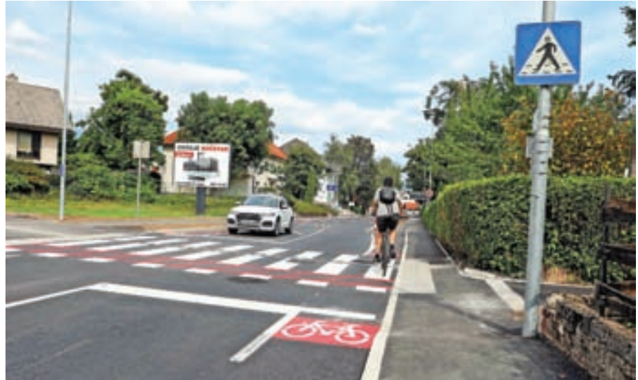
Nova podoba Ceste Staneta Žagarja

Konec avgusta so se končala dela na 500-metrskem odseku Ceste Staneta Žagarja med križiščema z Oldhamsko in Bleiweisovo cesto, ki so se začela že februarja. S tem so dogradili manjka-jočo kolesarsko povezavo Športni park Kranj–Avtobusna postaja Kranj, s čimer je Kranj pridobil varno kolesarsko pove-zavo med soseskami Primskovo, Vodo-vodni stolp, Center in avtobusno postajo znotraj gosto naseljenega dela mesta. Mestna občina Kranj (MOK) je na ome-njenem odseku obojestransko povezala dve kolesarski povezavi in s tem vzpo-stavila neposredno kolesarsko povezavo med Avtobusno postajo Kranj in Špor-tnim parkom Kranj. Hkrati so zame-njali in obnovili dotrajana vodovoda (po 150 metrov napajalnega voda za center mesta in povezovalnega vodovoda Stra-žišče–Vodovodni stolp), vse vodovodne priključke na trasi, 250 metrov fekalne kanalizacije in 280 metrov meteorne kanalizacije, s čimer so razbremenili dosedanji mešani kanalizacijski sis-tem in tudi centralno čistilno napravo. Obenem so uredili še vodovodne in ka-nalizacijske navezave na Cesti Kokrške-ga odreda, obnovili asfalt, dogradili in nadgradili vodovodno vozlišče. Na ce-