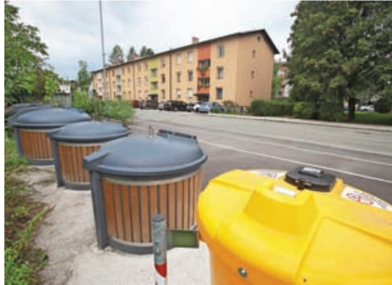
Komunala Kranj je na Partizanski cesti vzpostavila skupno odjemno mesto za odpadke.

Nadaljnjo dinamiko postavljanja podzemnih ekoloških otokov bodo usklajevali z lokalno skupnostjo in upravniki, še pojasnjujejo v komunalnem podjetju in dodajajo: »Vsekakor