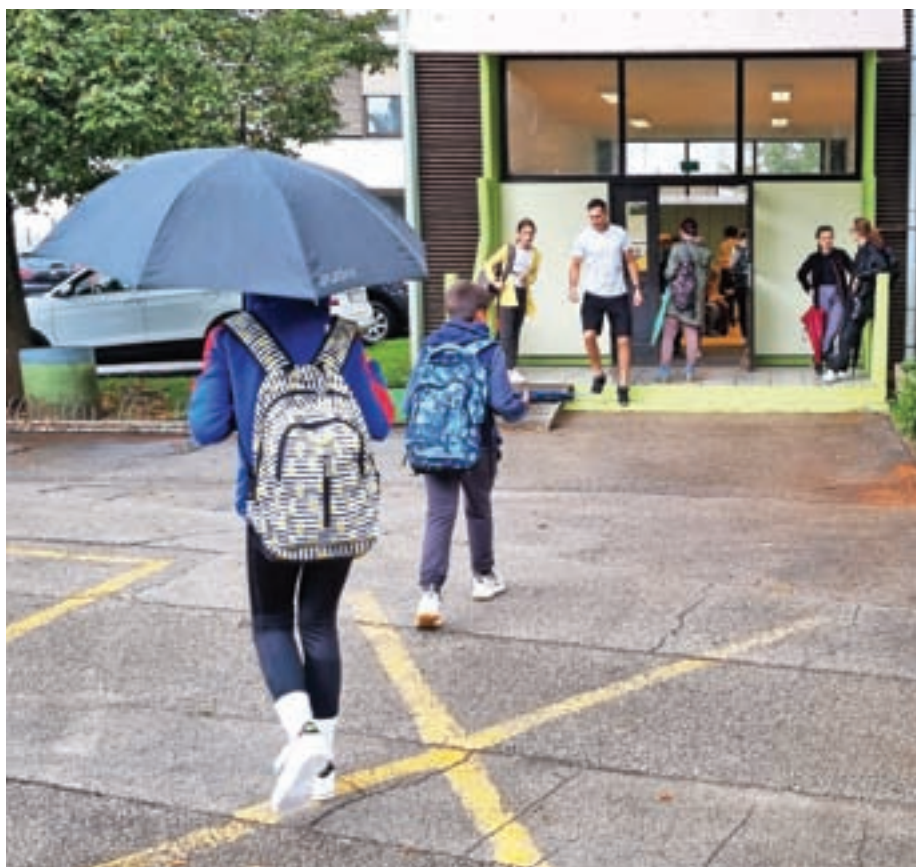
Osnovno šolo Simona Jenka Kranj trenutno obiskuje 754 učencev.

Konec septembra se učenci po dveh koronskih letih ponovno odpravljajo na nadstandardno ekskurzijo na Škotsko. »Tudi zato upam, da nas bo korona kar pustila pri miru. Ekskurzije se po dvehletnem premoru res veselimo, vsi smo v pričakovanju, da nam jo bo uspelo izvesti,« je še dejala Klemenčičeva.