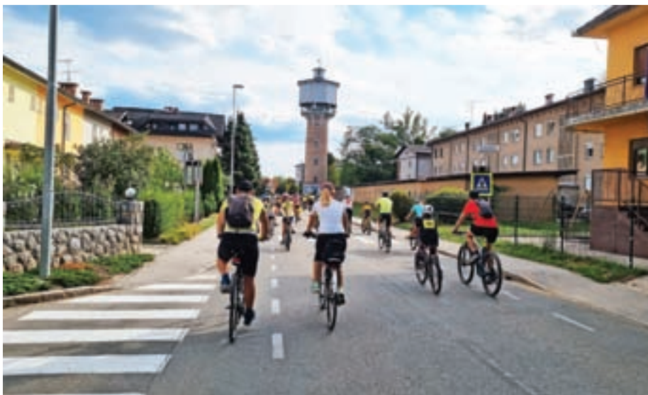
V Evropskem tednu mobilnosti spodbujajo k trajnostni mobilnosti. Slika je simbolična.

Mestna občina Kranj v okviru ETM 2022 pripravlja program, ki vključuje tako predstavitve kot praktične prikaze posameznih ukrepov trajnostne mobilnosti. Danes, 20. septembra, bodo na Glavnem trgu in v Stičišču kulturnih društev Kranj med 10. in 12. uro potekale delavnice uporabe aplikacij za bolj trajnostno mobilnost (grem z vlakom, Arriva, GoogleMaps) ter predstavitvi Svetovalnega organa za razvoj kolesarstva gorenjske regije in Gorenjskega kolesarskega omrežja – REKREATUR. Jutri, 21. septembra, bodo na istih prizoriščih potekale izobraževalne delavnice, 22.