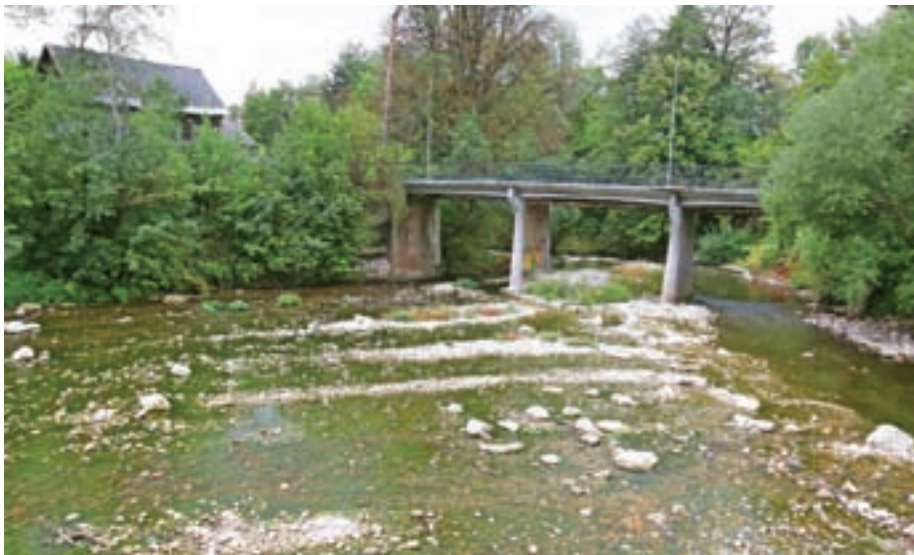
Zaradi nizkega vodostaja je tudi Kokra poleti izgubila zmožnost naravnega prečiščevanja.

Poletne analize voda v kanjonu reke Kokre so pokazale, da se v reki pojavlja fekalno onesnaženje. V njej so namreč odkrili mikrobiološke parametre, kot so enterokoki in E.coli, ki so prisotni v fekalni vodi živih bitij ter v vodi, uporabljeni v poljedelstvu, obenem pa nakazujejo nepravilno in nelegalno izlivanje greznic in gnojevke. Mestna občina Kranj je zato naročila letni monitoring, v katerem bodo vodo do avgusta 2023 vzorčili na treh odvzemnih mestih, na podlagi rezultatov pa se bodo z vsemi deležniki odločili o nadaljnjih ukrepih. Na MOK ob tem znova pozivajo vse, da se do predpisanega roka priključijo na javno komunalno infrastrukturo.