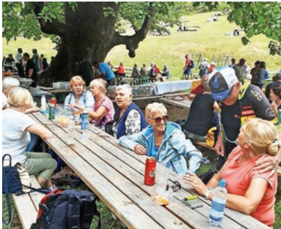
Na spominski slovesnosti ob 81. obletnici ustanovitve Cankarjevega bataljona in praznika Občine Radovljica