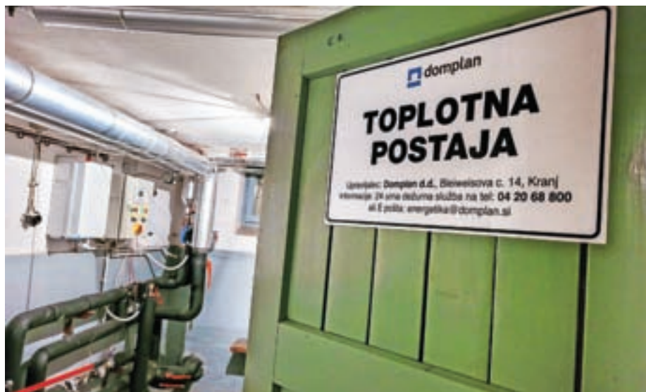
Domplan bo po tridesetih letih prenehal dobavljati zemeljski plin.

V Domplanu pojasnjujejo, da bi njihova izguba ob regulirani ceni zemeljskega plina 0,073 evra/kWh za gospodinjske odjemalce in skupne gospodinjske odjemalce ter 0,079 evra/kWh za osnovne socialne službe in male poslovne odjemalce v enoletnem obdobju ter ob predpostavki borzne cene zemeljskega plina 0,230 evra/kWh (borzna cena sicer močno niha na dnevnem nivoju) znašala več kot tri milijone evrov.